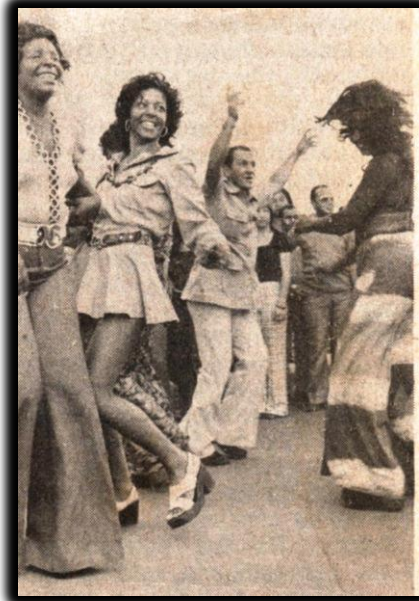
Na avenida os adeptos do samba aderiram aos requebros das mulatas que punham nos pés a alma de sambistas

Em meados de fevereiro de 1969. Um grupo de operários, empregadas domésticas, funcionários públicos e alguns doutores chegados de outros Estados, resolveram dar mais calor ao carnaval da Asa Norte e fundaram o Bloco Acadêmicos da Asa Norte.